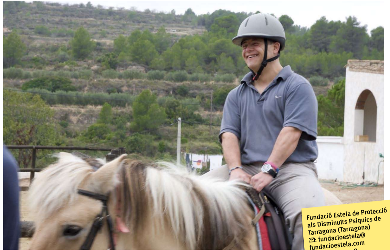
Un equipo de especialistas en equinoterapia dará asistencia al proyecto.

Fundació Estela de Protecció als Disminuïts Psíquics de Tarragona (Tarragona) ✉: fundacioestela@fundacioestela.com ☎: 977 20 40 08