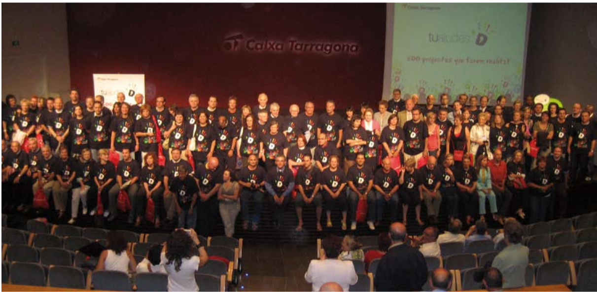
El Auditorio Caixa Tarragona acogió cerca de 300 personas.

Caixa Tarragona ha entregado los convenios de colaboración de la Obra Social con entidades sin ánimo de lucro en tres actos que han contado con una alta participación.