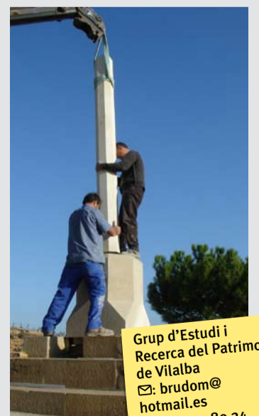
La cruz de término de la Costa de la Font.

El municipio de Vilalba dels Arcs estrenará en breve la nueva cruz de término de la Costa de la Font. Cuando acaben las obras de restauración del monumento, la cruz tendrá el mismo aspecto que lucía en 1922. La recuperación de este elemento emblemático ha sido integral, desde la base hasta la cruz superior.