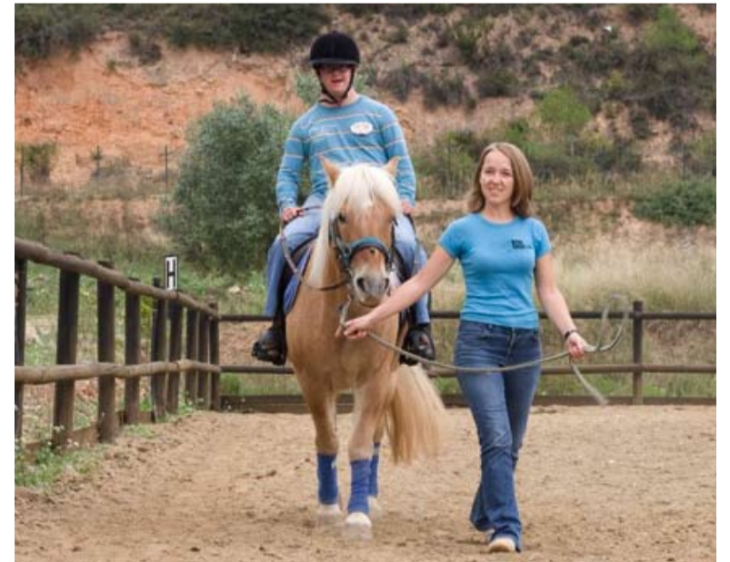
La equinoterapia aporta un gran número de beneficios terapéuticos.

entidad en el Pont d'Armentera (Alt Camp) durante los próximos ocho meses. Más en la página 2