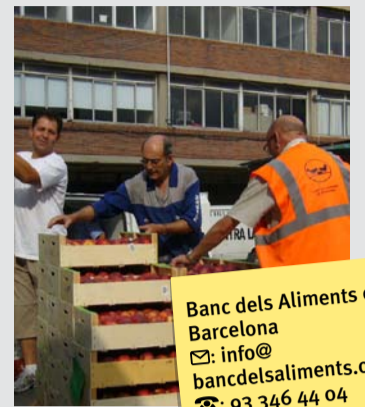
Una gran cantidad de alimentos se distribuyen cada día.