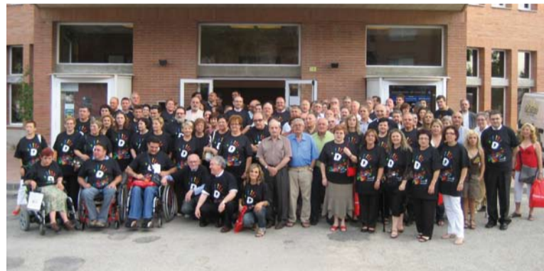
En Tortosa se reunieron cerca de 70 entidades.

Unas ayudas económicas que repercutirán en el territorio donde Caixa Tarragona está presente.