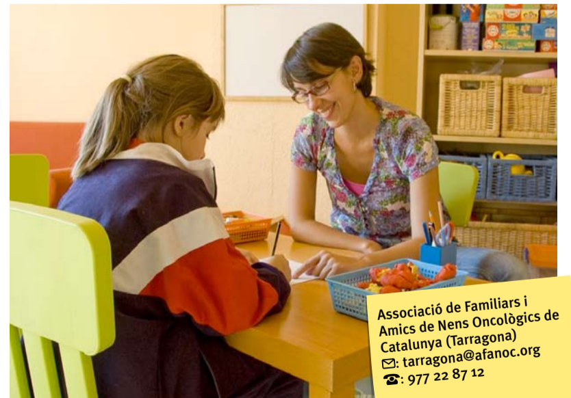
AFANOC da apoyo a enfermos y cuidadores.

Con este proyecto, que ha recibido un amplio apoyo de los clientes preferentes de Caixa Tarragona, AFANOC proporcionará apoyo psicosocial, voluntariado a domicilio, recursos peda-