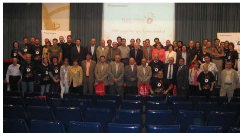
El acto de Reus contó con la participación de más de 60 entidades.