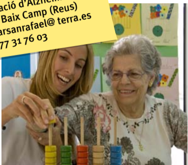
La entidad cuenta con un equipo para la atención integral del enfermo.

Associació d'Alzheimer de Reus i Baix Camp (Reus) ✉: afarsanrafael@terra.es ☎: 977 31 76 03