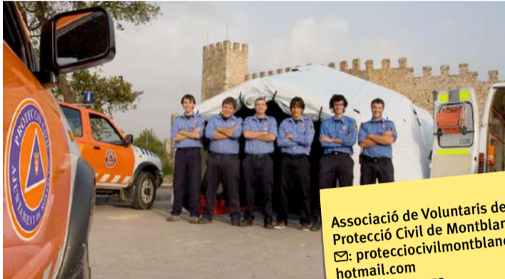
Los voluntarios estrenarán en breve el hospital.

rragona, integrará el hospital como un servicio más del equipo de emergencias. Según comenta el jefe de Protección Civil, Xavier Figueras , "la estructura permitirá cubrir y mejorar las necesidades derivadas de la actuación de la asociación".